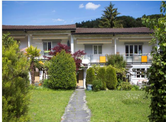
1 | 8 Besonders schützenswert: Die Ankenweid in Leimbach. (8 Bilder)

Volle drei Viertel der ganzen Stadt sollen erhalten bleiben, wie sie sind – so will es das neue Bundesinventar der schützenswerten Ortsbilder. Das stellt die Stadt vor neue Probleme.